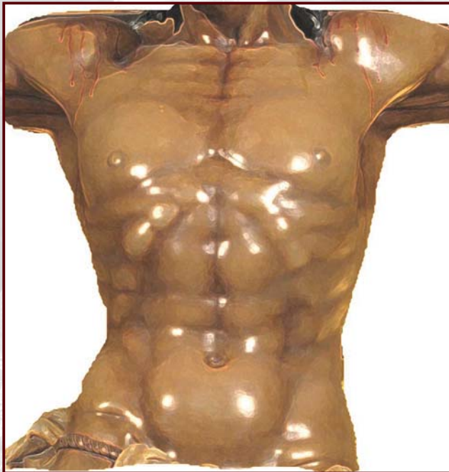
Dibujo 8. Detalle de tórax expandido.

Así en esta situación de inspiración esta nuestro Crucificado. Las costillas son proyectadas directamente hacia delante, de tal forma que el esternón se mueve también hacia delante separándose de la columna vertebral. Con ello el diámetro antero posterior del tórax de este Crucificado en inspiración máxima es de ciento cuatro centímetros, un veinte por ciento superior al diámetro que en espiración. Se ayuda además con la musculatura supraclavicular y la abdominal, que se hunden completamente para ganar presiones negativas en el interior de la caja torácica. Dibujo 8