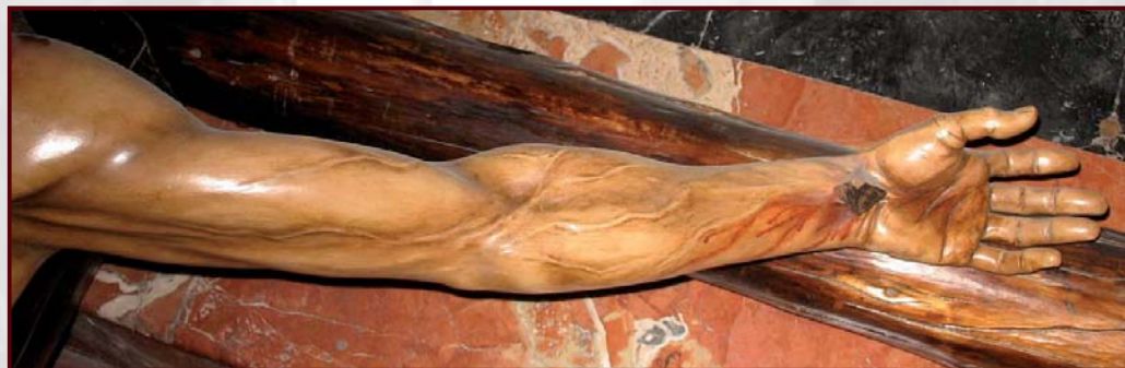
Dibujo 7. Detalle de sistema venoso superficial en la flexura del brazo

Debido a la tensión muscular y como consecuencia de la superficialidad de las mismas podemos entrever entre los grupos musculares parte del sistema venoso superficial con detalle. 2 Dibujo 7.