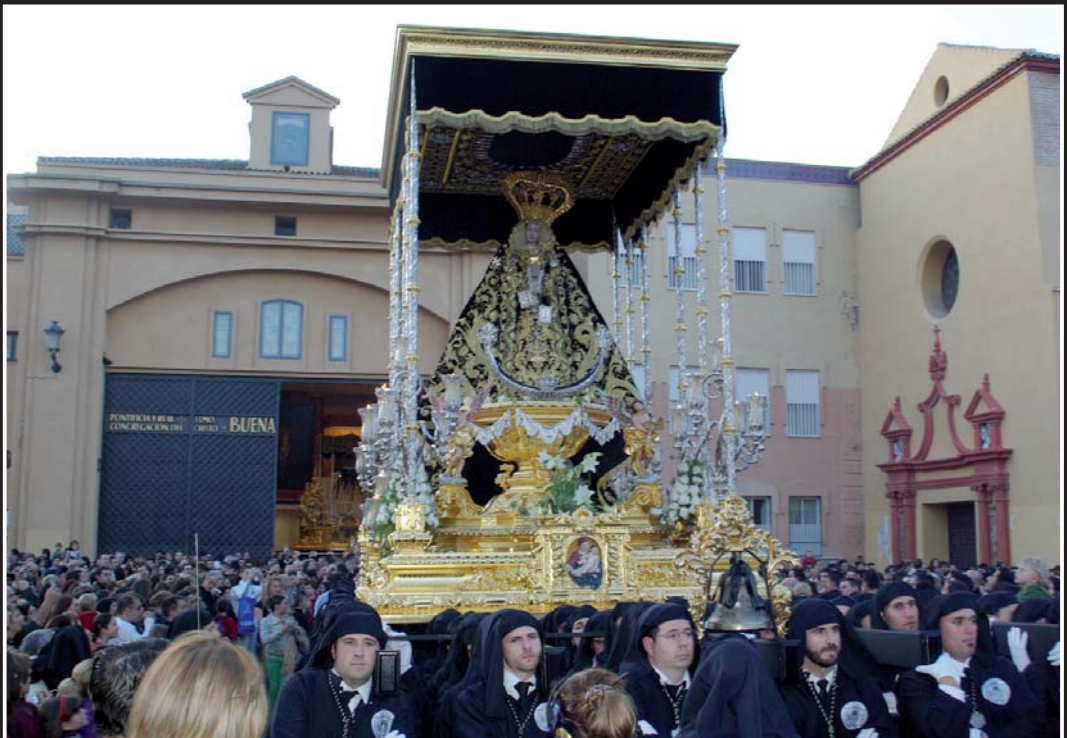
Salida de Nuestros Sagrados Titulares desde la iglesia de Santo Domingo.