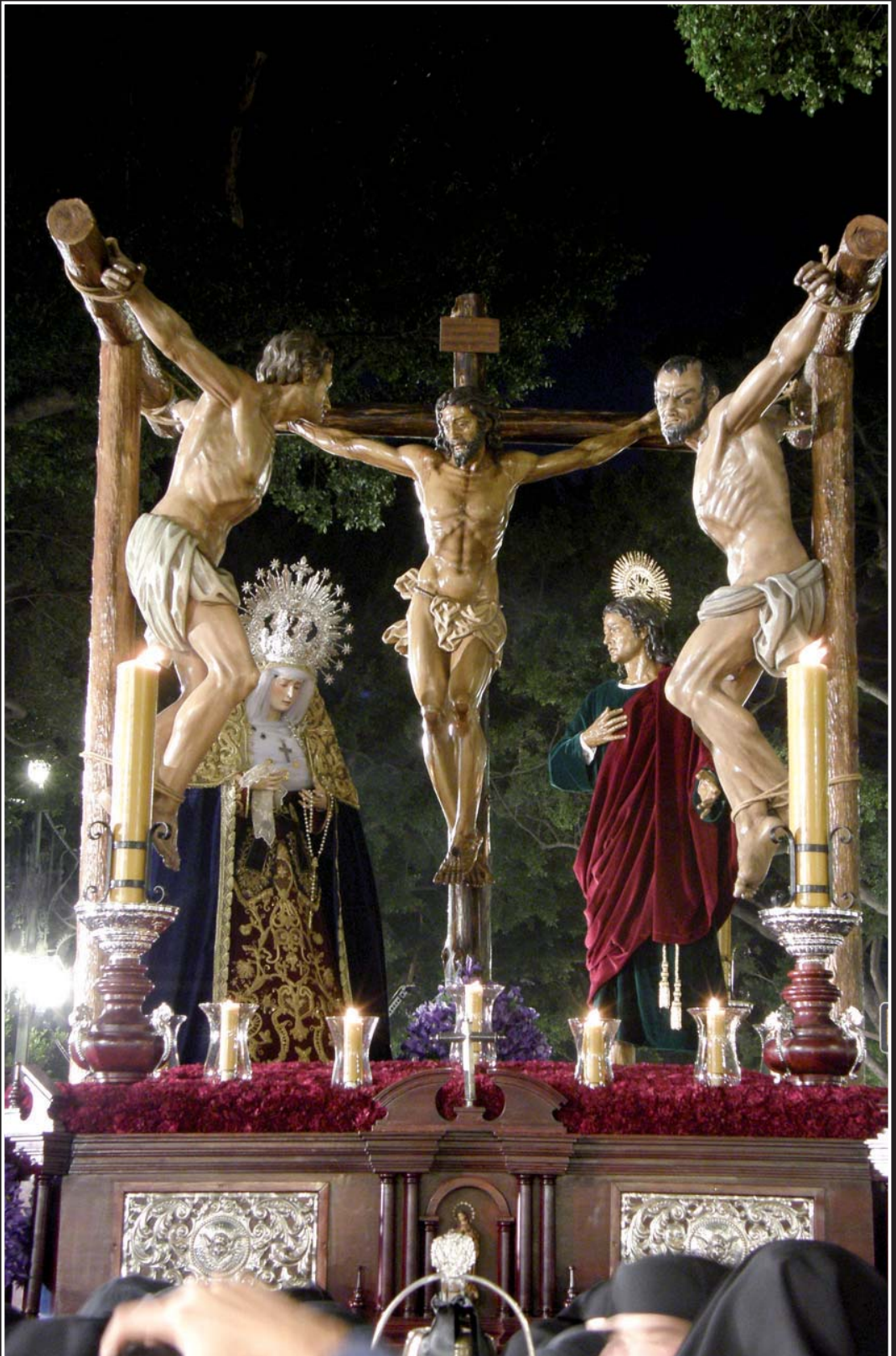
El grupo escultórico del Santísimo Cristo del Perdón a su paso por la Alameda Principal.