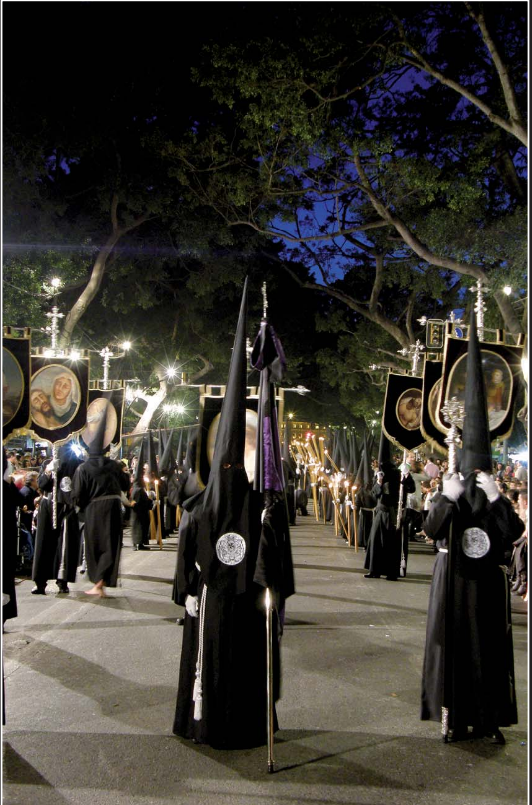
Sección del Cristo en la Alameda Principal.