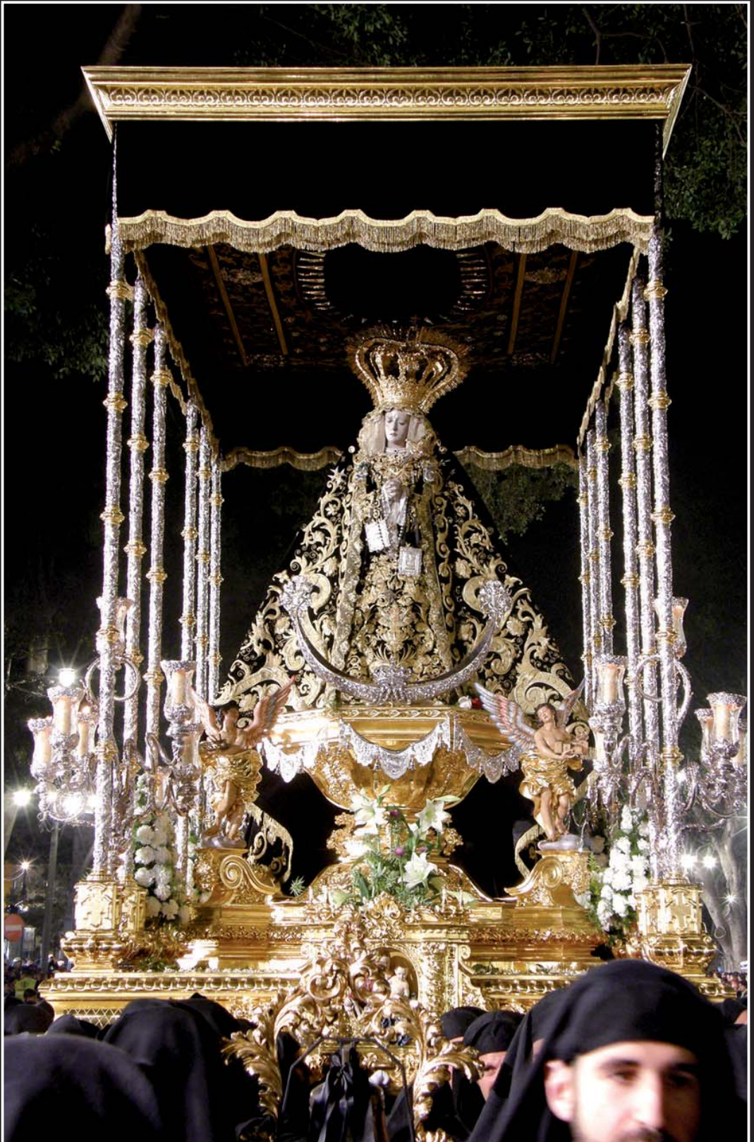
El trono de Nuestra Señora de los Dolores por la Alameda Principal.