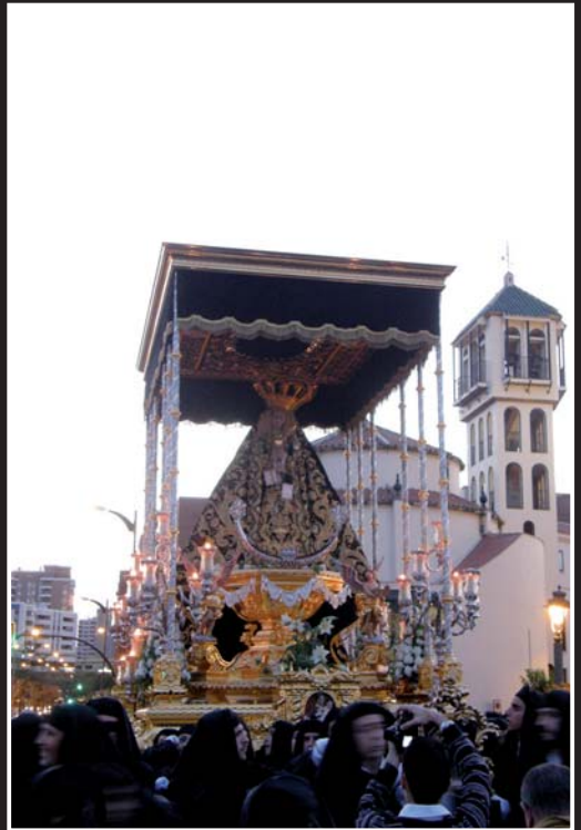
En las inmediaciones de la Basílica de la Archicofradía del Paso y la Esperanza.