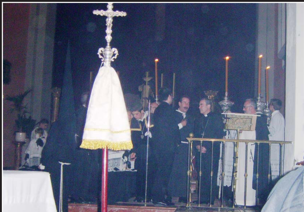
Don Jesús presidió la Salida Procesional de nuestra Cofradía en la tarde-noche del Lunes Santo.