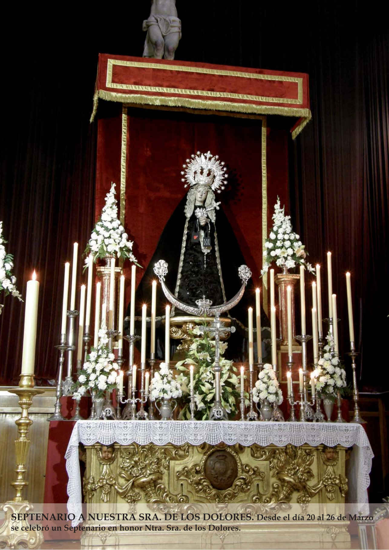
SEPTENARIO A NUESTRA SRA. DE LOS DOLORES. Desde el día 20 al 26 de Marzo se celebró un Septenario en honor Ntra. Sra. de los Dolores.