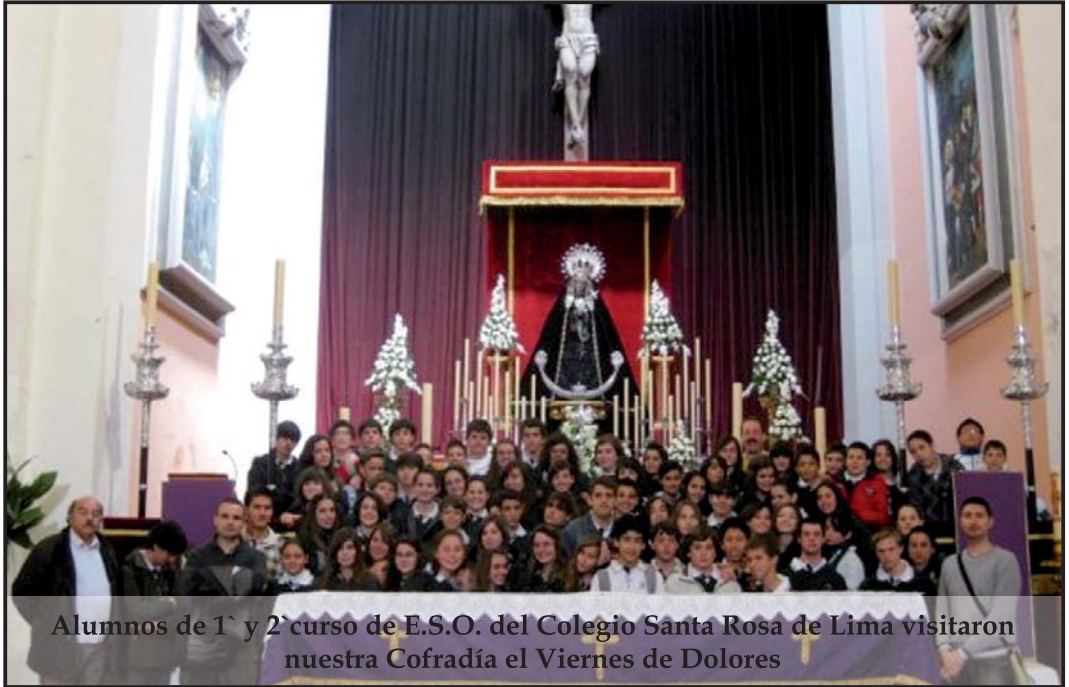
Alumnos de 1º y 2º curso de E.S.O. del Colegio Santa Rosa de Lima visitaron nuestra Cofradía el Viernes de Dolores