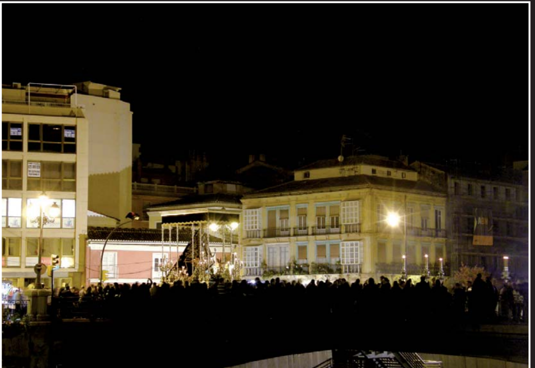
Nuestro cortejo por calle Carretería, Tribuna de los Pobres y el puente de la Aurora.