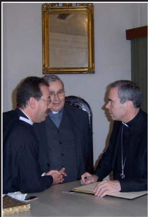
Nuestro Obispo quiso acompañarnos el Lunes Santo.