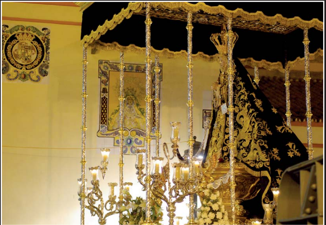
De recogida, entre el Puente y la Capilla.