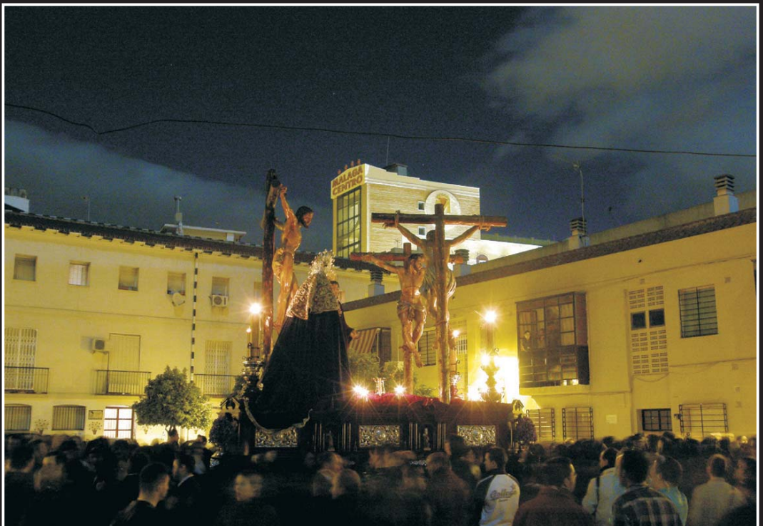
De vuelta por nuestro Barrio, volvimos a transitar por la Plaza Imagen y Martinete.