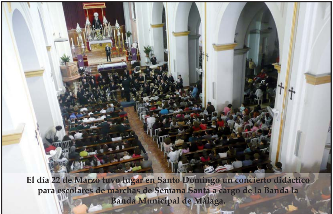
El día 22 de Marzo tuvo lugar en Santo Domingo un concierto didáctico para escolares de marchas de Semana Santa a cargo de la Banda la Banda Municipal de Málaga.