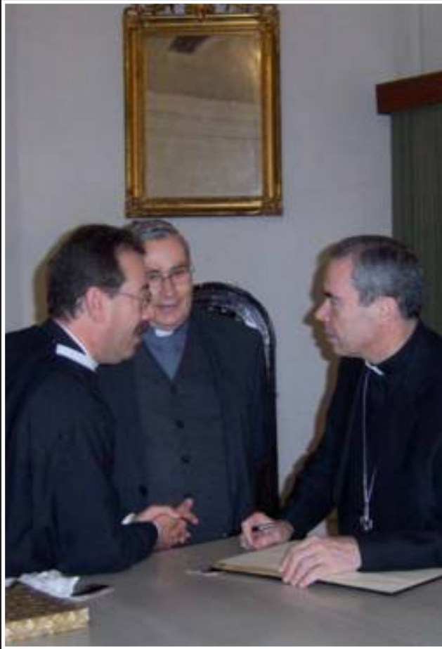
Nuestro Obispo quiso acompañarnos el Lunes Santo.