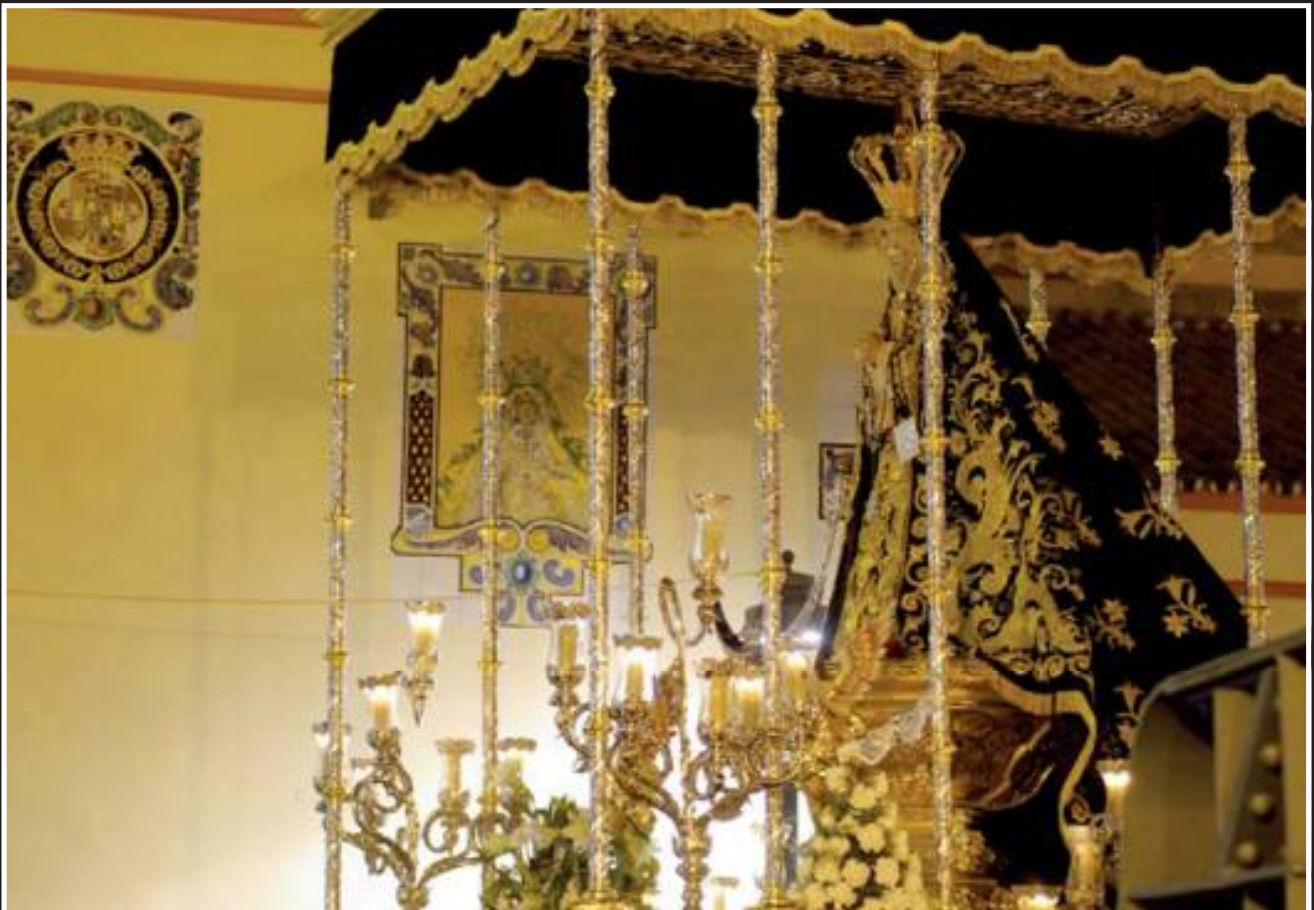
De recogida, entre el Puente y la Capilla.