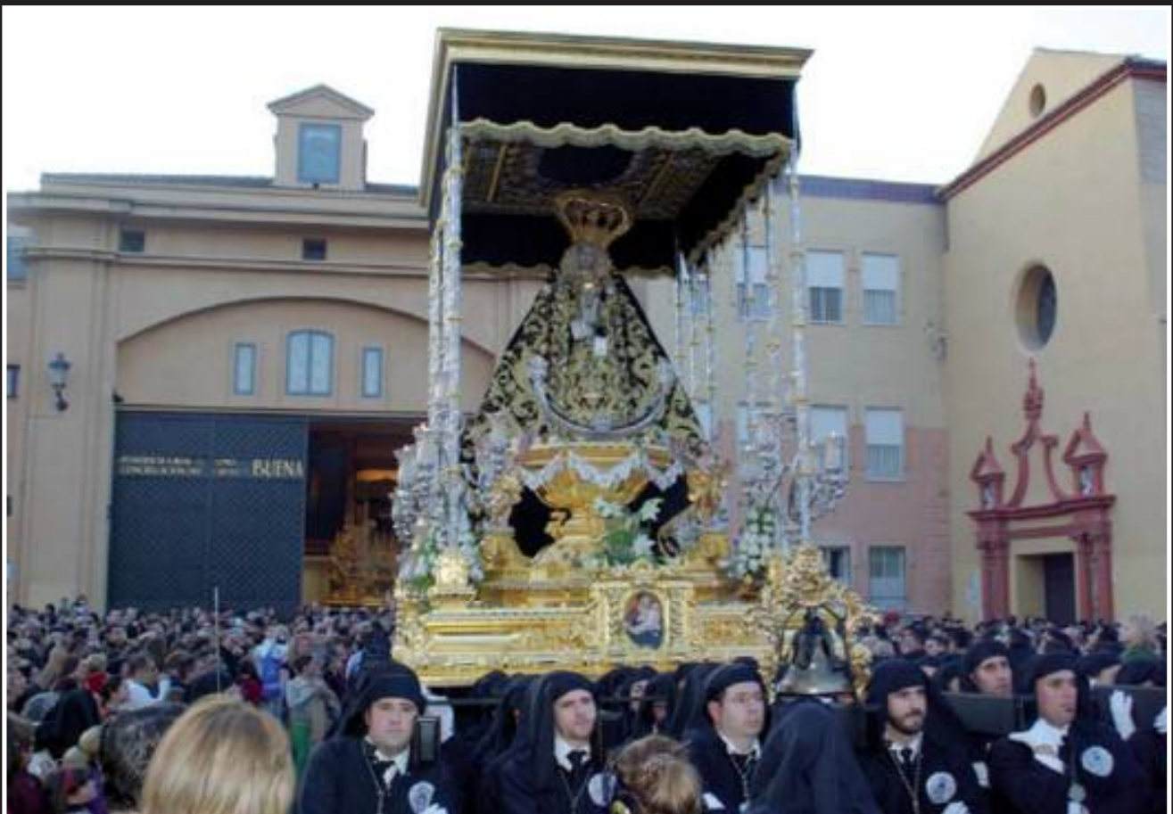
Salida de Nuestros Sagrados Titulares desde la iglesia de Santo Domingo.