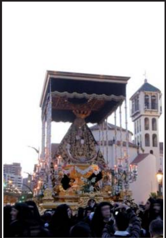
En las inmediaciones de la Basílica de la Archicofradía del Paso y la Esperanza.