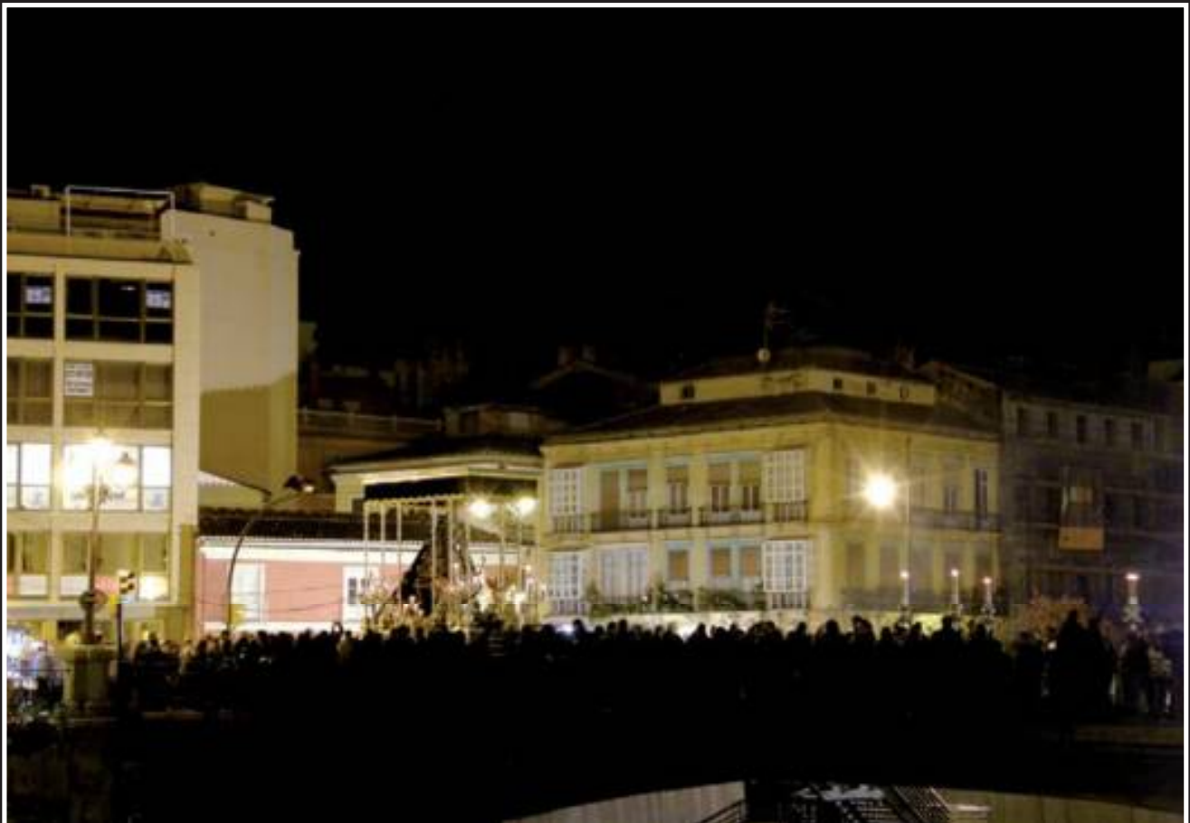
Nuestro cortejo por calle Carretería, Tribuna de los Pobres y el puente de la Aurora.