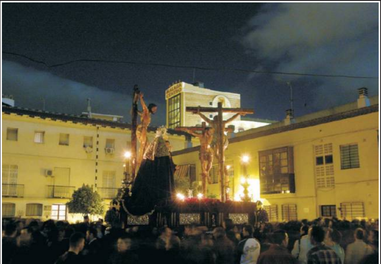
De vuelta por nuestro Barrio, volvimos a transitar por la Plaza Imagen y Martinete.