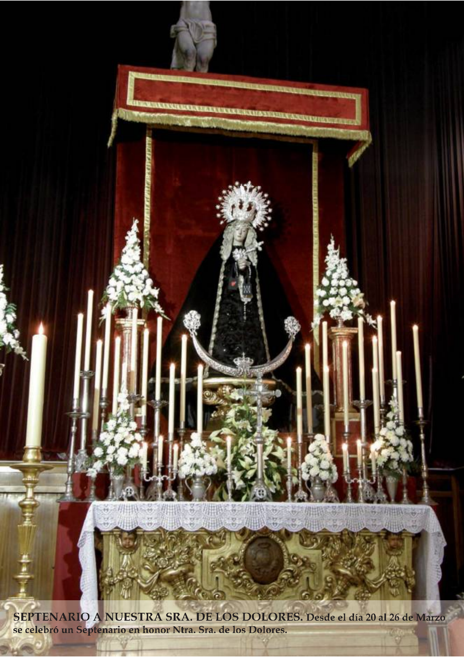
SEPTENARIO A NUESTRA SRA. DE LOS DOLORES. Desde el día 20 al 26 de Marzo se celebró un Septenario en honor Ntra. Sra. de los Dolores.