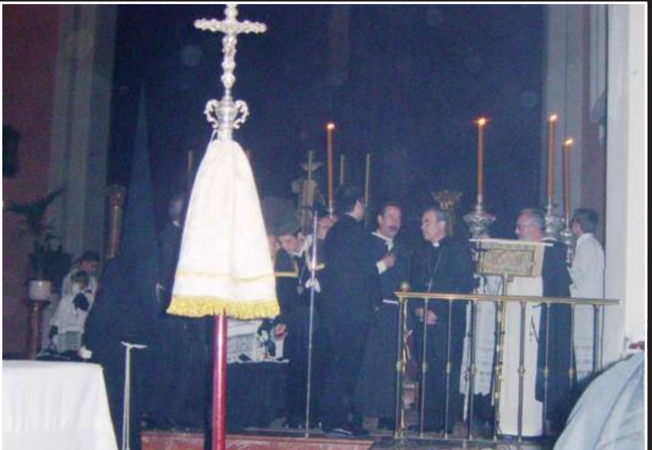
Don Jesús presidió la Salida Procesional de nuestra Cofradía en la tarde-noche del Lunes Santo.