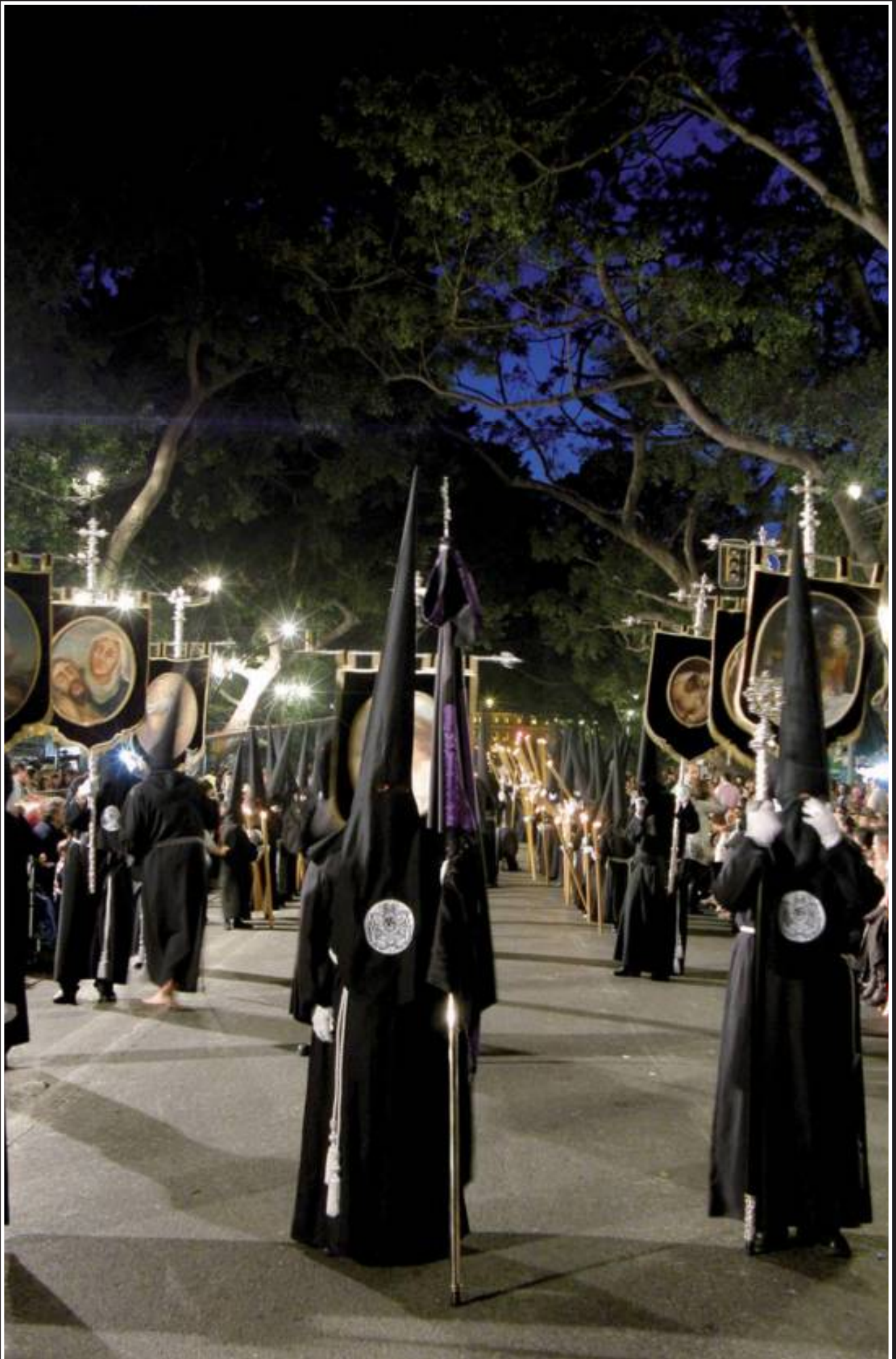
Sección del Cristo en la Alameda Principal.