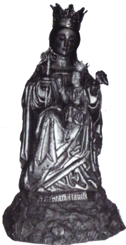
Nuestra Señora de la Victoria (Patrona de Málaga)