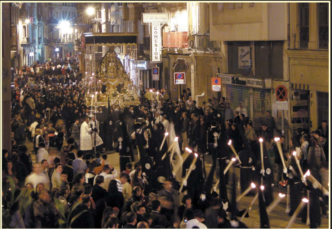
La Virgen de los Dolores a su paso por Carretería