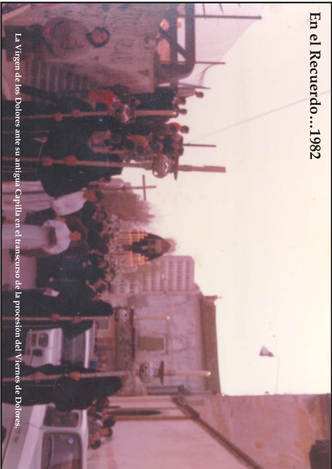
La Virgen de los Dolores ante su antigua Capilla en el transcurso de la procesión del Viernes de Dolores.