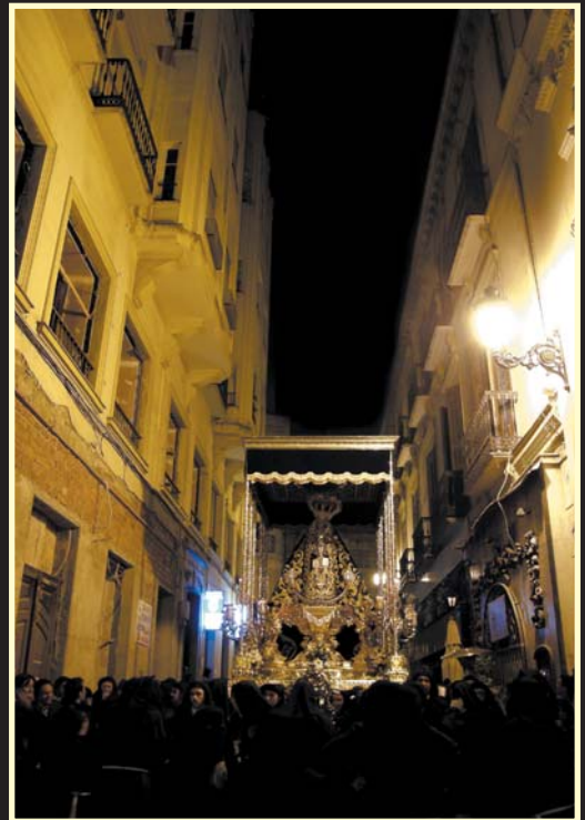
Después de varios años nuestra Cofradía retomó el paso por calle Echegaray