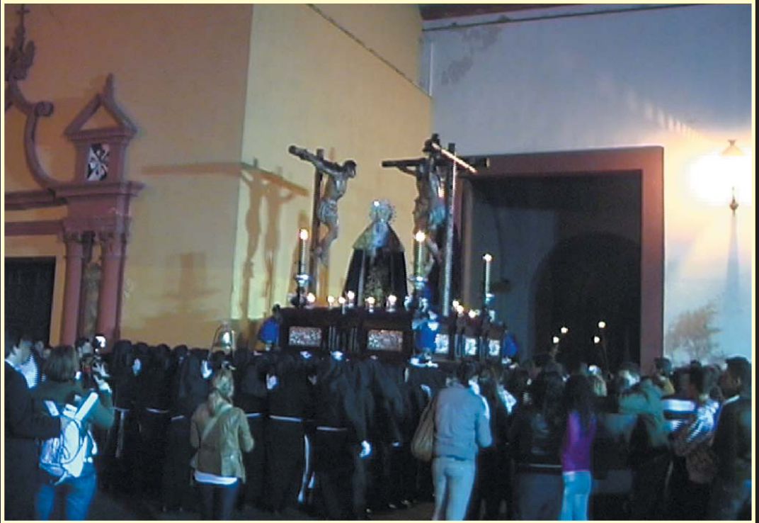
Culminación de nuestra Estación de Penitencia con la entrada de los Titulares en la iglesia de Santo Domingo