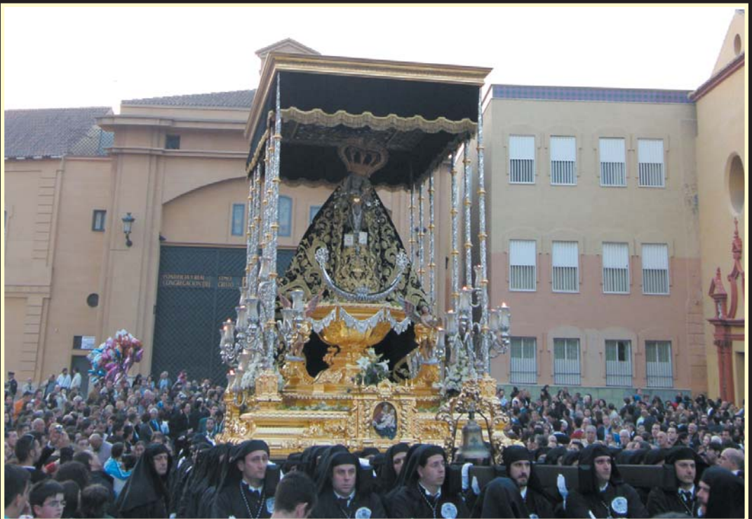
En las inmediaciones de Santo Domingo, numerosas personas esperaba la salida de la Virgen de los Dolores.