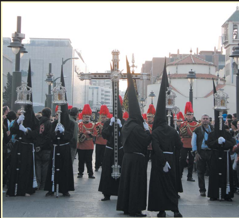
Nuestra Cofradía a su paso por el Puente de la Esperanza.