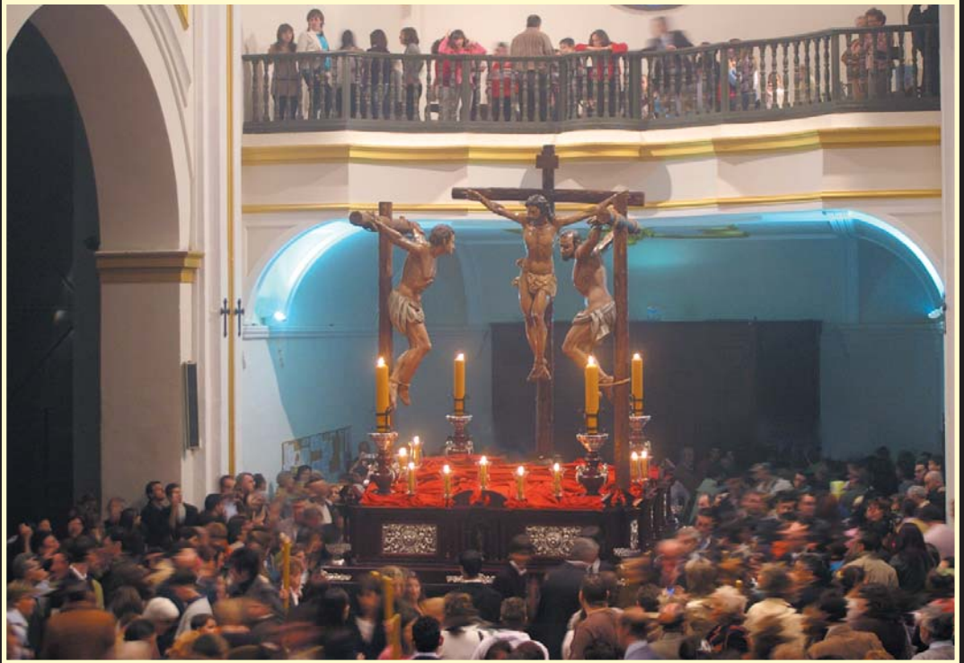
Momento del traslado del Santísimo Cristo del Perdón el Viernes de Dolores