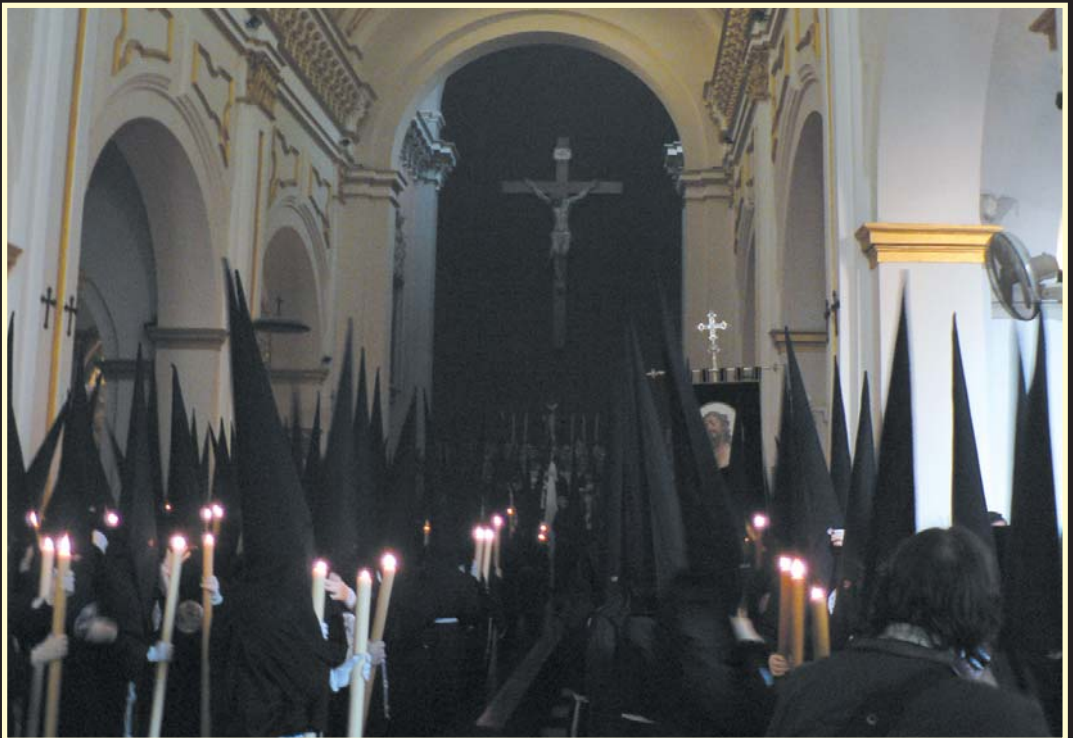
Salida del cuerpo de nazarenos de la sección del Santísimo Cristo del Perdón