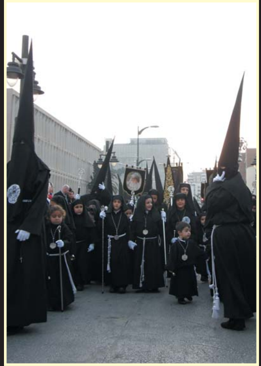
Nuestra Procesión de nazarenos.