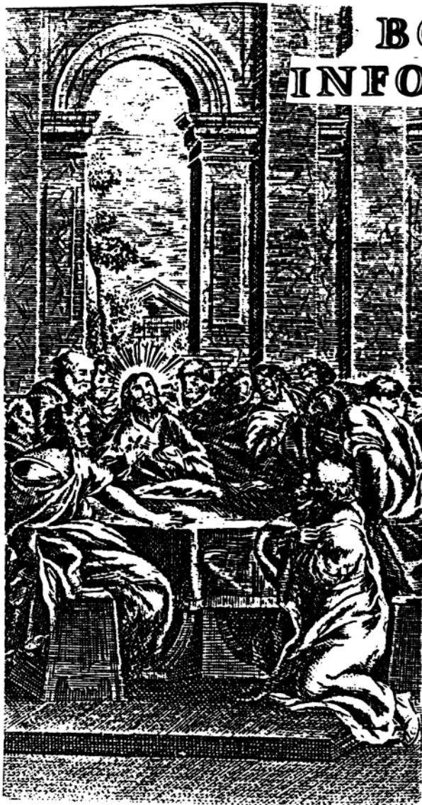
La Última Cena de Jesús, grabado en acero por Tiepolo, 1765.